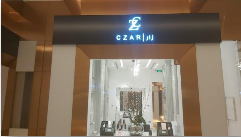
Main Store: Located in The Avenues Mall - المتجر الرئيسي يقع في الأفنيوز مول -