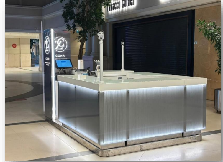
Located in Marina Mall in front of Taraf al Agar - فرع مارينا مول مقابل الطرف الأغر -