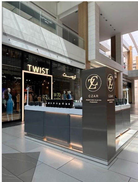
A booth at The Avenues كشك في الأفنيوز مول، أمام متجر تويست Mall, in the corridor in front of the Twist shop.